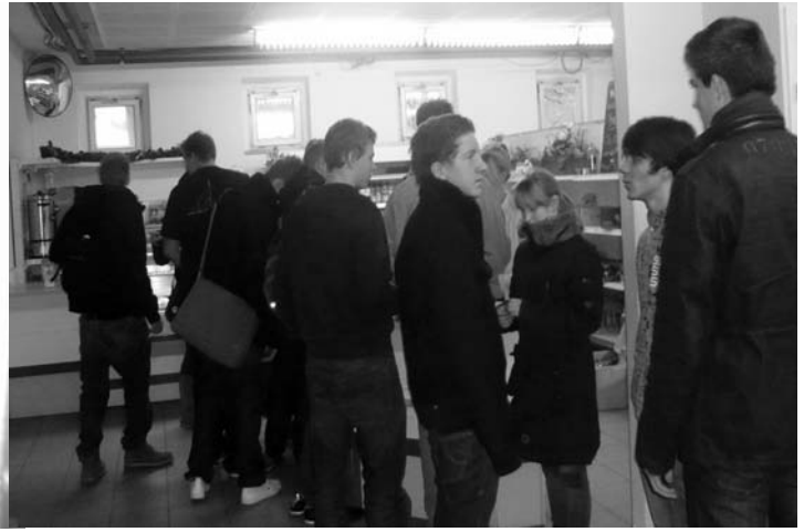
Während ein Schultag so dahinplätschert, ...rotten sich immer wieder hungrige und frierende Gestalten vor den leckeren Auslagen der Delikatessen-Abteilung zusammen.