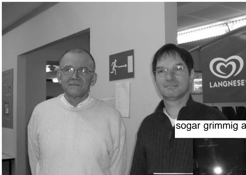
sogar grimmig ausschauende Doppelposten ziehen auf!