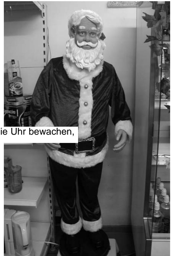
Verdeckte Ermittler müssen die Kostbarkeiten rund um die Uhr bewachen,