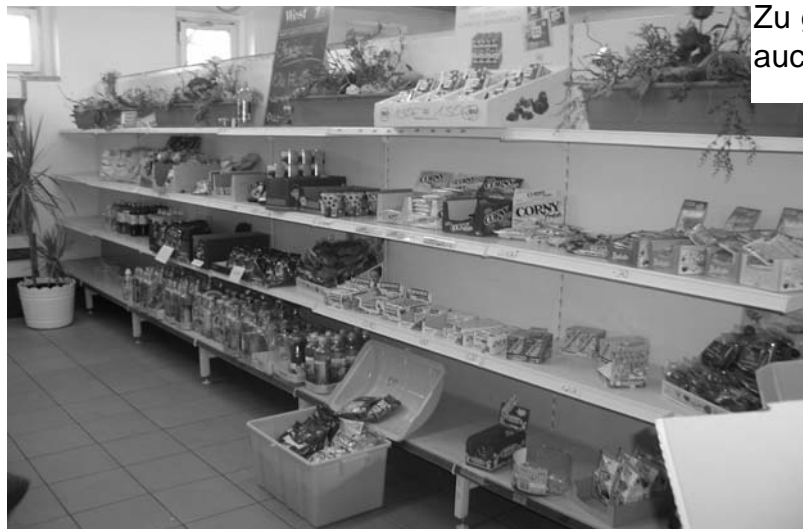
Zu groß ist der Hunger, zu verlockend aber auch die Überfülle der Köstlichkeiten!