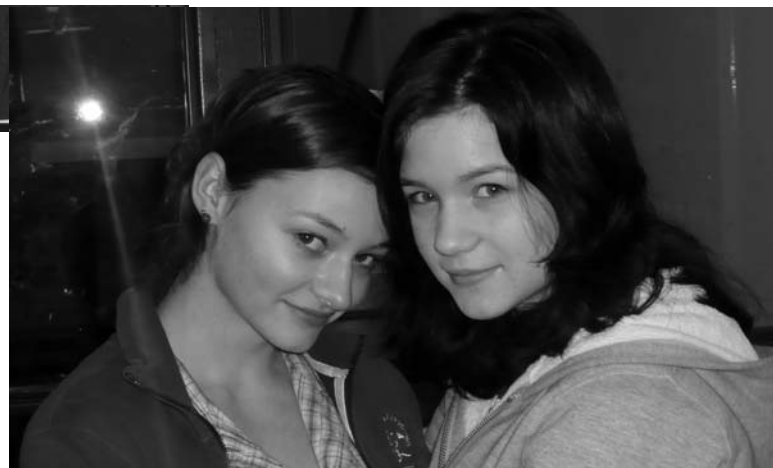
Oder gucken die womöglich ganz woanders hin?